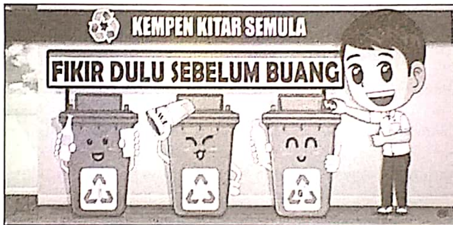
Sumber pendapatan sampingan