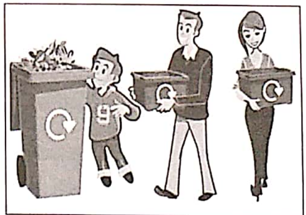
Menggunakan bahan buangan semula