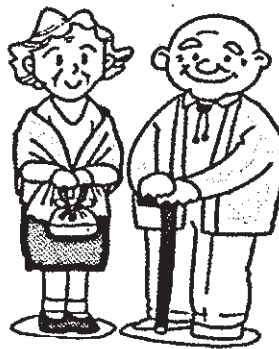
Simpanan hari tua