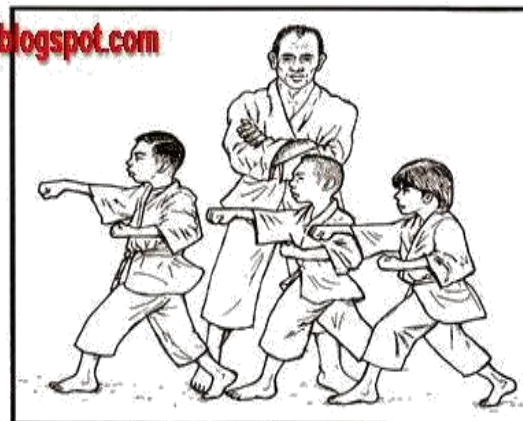
Mempelajari ilmu pertahanan diri