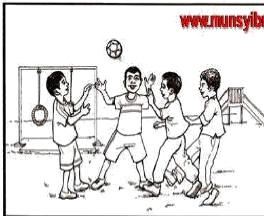
Sentiasa berada dalam kumpulan