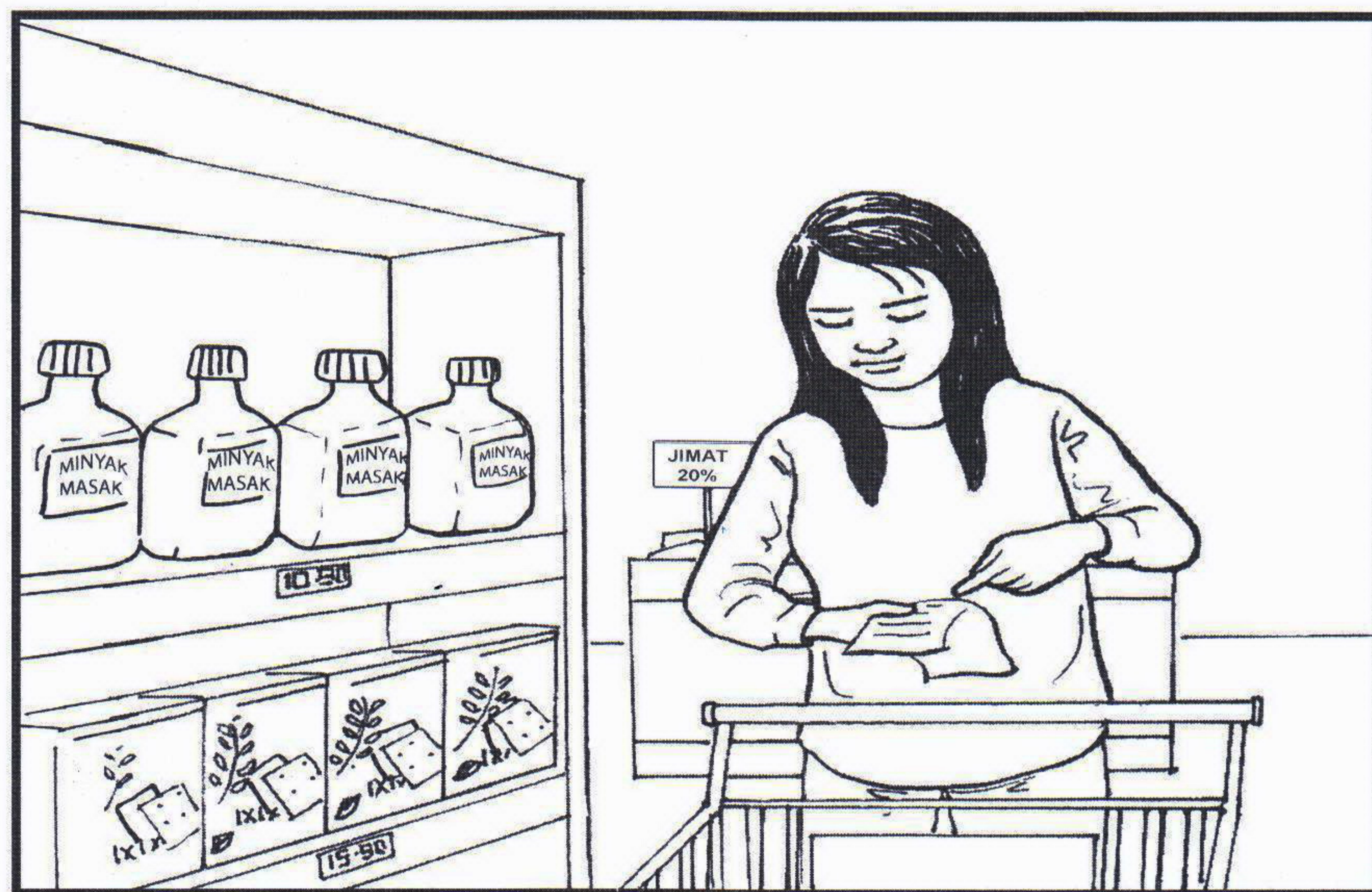
Menyediakan senarai barangan yang hendak dibeli