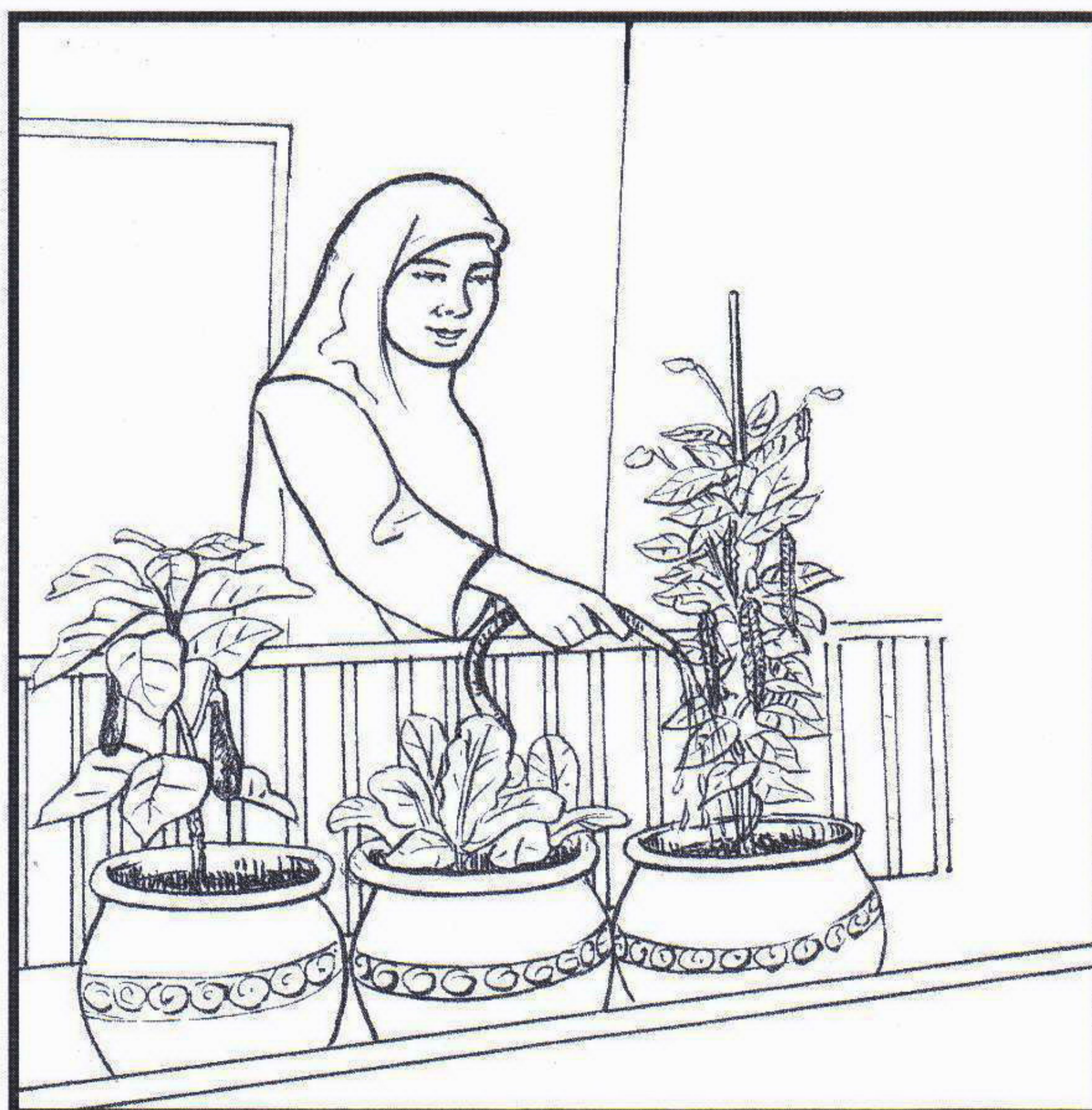
Menanam sayuran untuk kegunaan sendiri