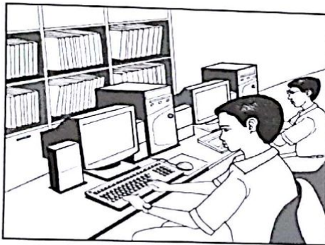
Kemudahan Internet untuk mengakses maklumat